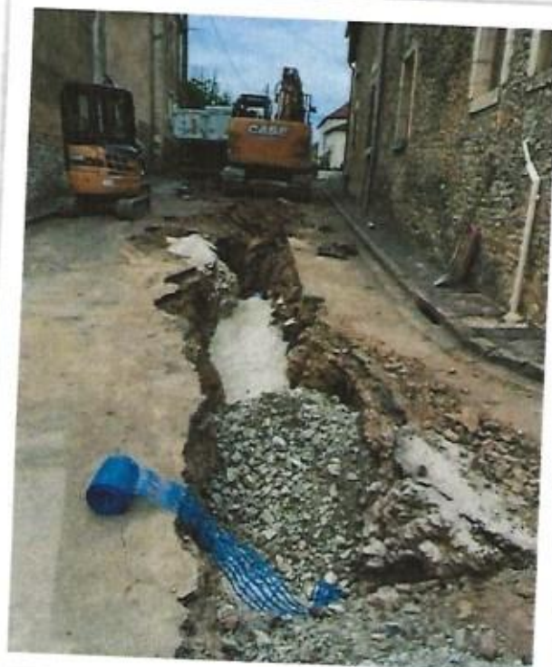
Souvenir de 2022

Considérant que nous avons réimplanté un verger de sauvegarde, des haies, et que nous faisons le choix de plantes vivaces ou de végétation durable, le département nous demande régulièrement de