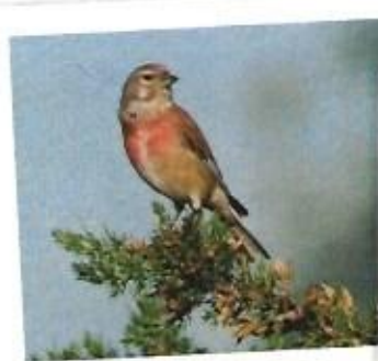
Linotte mélodieuse, mâle, plumage nuptial

La location des terrains et les différentes redevances devraient rapporter à la commune environ 35 000 € par an.