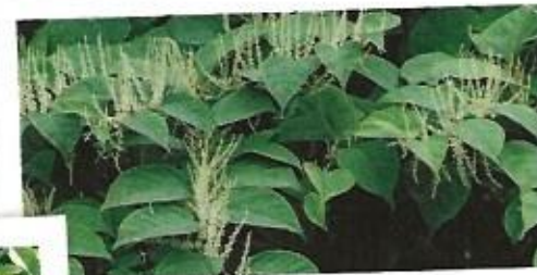
© M. Carret. Renouée du Japon